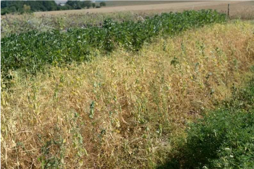
Reinsaatbestände (von links nach rechts): Sommerackerbohne, Sommererbse, Blaue Lupine am Standort Schafhäuser, 27-07-2018

Fotodokumentation zum Projekt „Erprobung innovativer Anbaustrategien für ökologisch wirtschaftende Milchviehbetriebe in Mittelgebirgslagen“ – Teilbereich Körnerleguminosen – Versuchsjahr 2017 / 18