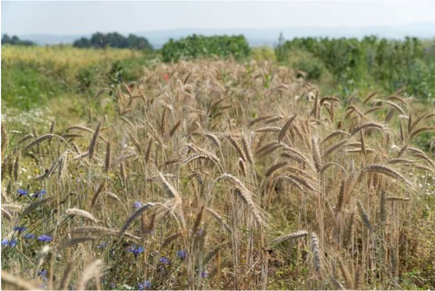
Bestand mit Wintertriticale am Standort Schafhäuser, 27-07-2018