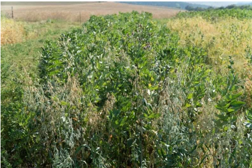
Variante Sommerackerbohne im Gemenge mit Gelbhafer am Standort Schafhäuser, 27-07-2018